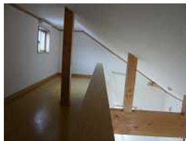
勾配天井を活かしたロフト