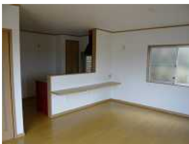
北向きでも明るいLDK