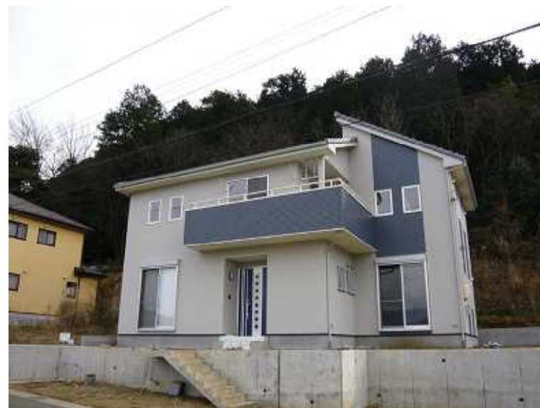
写真・図面等のデータは、お施主様の許可を得て掲載させていただいております。