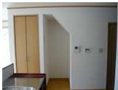
階段下を利用した収納