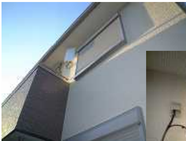
こだわりの壁付TVアンテナ