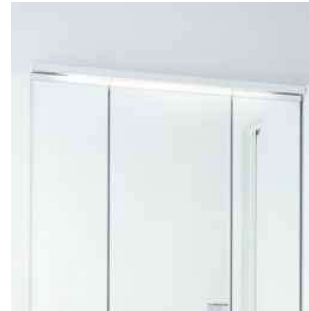
薄型のLED照明で空間すっきり。 省エネ・長寿命を実現しています。