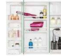
コンセント 3個 (うち収納内2個) 収納例 ※写真はスリムLED3面鏡 幅900mmの収納例です。

電動ハブラシなどを 充電しながら収納できる。 収納内部にコンセントを 2個設置。バッテリー切れや 充電中の出しっぱなしを なくせます。