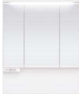
スリムLED3面鏡 ミドルパネル